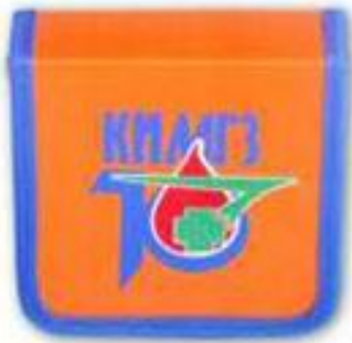
Комплект индивидуальный медицинский гражданской защиты (КИМГЗ) по приказу 70н