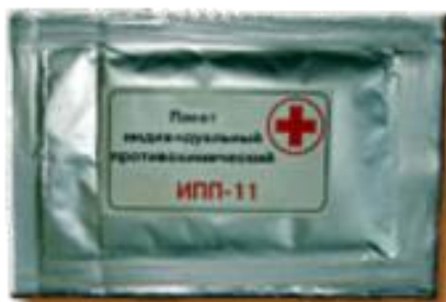
Индивидуальный противохимический пакет ИПП-11

Предназначены для оказания первой медицинской само- и взаимопомощи посредством наложения первичных повязок на раны при несчастных случаях, стихийных бедствиях, техногенных авариях и других экстремальных ситуациях, в том числе в военных условиях.