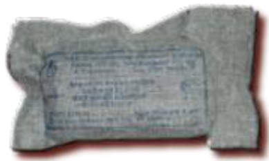
Индивидуальный перевязочный пакет ИПП-1

Предназначены для оказания первой медицинской само- и взаимопомощи посредством наложения первичных повязок на раны при несчастных случаях, стихийных бедствиях, техногенных авариях и других экстремальных ситуациях, в том числе в военных условиях.