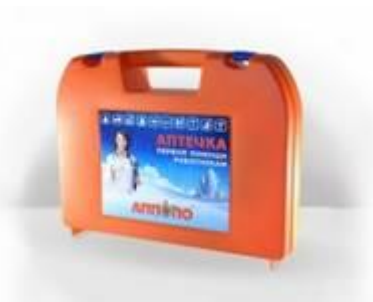
Аптечка первой помощи работникам (в пластиковом чемодане)

Сумка санитарная с укладкой имеет назначение для оказания первой помощи в полевых условиях и соответствует требованиям служб ГО и ЧС. Сумка санитарная состоит из набора перевязочных средств и медикаментов для оказания первой медпомощи, вложенных в специальную укладку. Санитарная сумка входит в оснащение санитаров воинских подразделений, а также санитарных дружин.